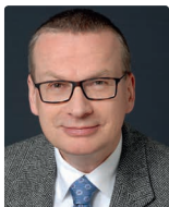
Uwe Brocks Medizinrechtsanwälte e.V.