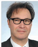
Jörg F. Heynemann Medizinrechtsanwälte e.V.