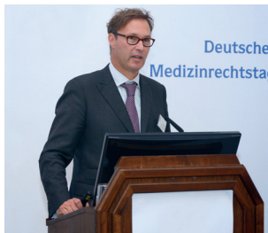
Jörg F. Heynemann Medizinrechtsanwälte e.V.