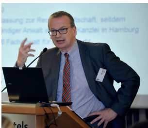
Uwe Brocks Medizinrechtsanwälte e.V.