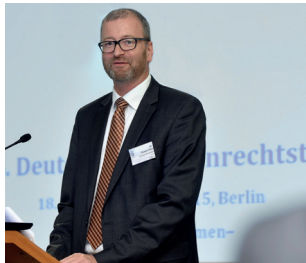
Dr. Thomas Motz Medizinrechtsanwälte e.V.

deltacom Projektmanagement GmbH Gertigstraße 59, 22303 Hamburg Tel.: 040 / 35 72 32 0, Fax: 040 / 35 72 32 90 E-Mail: info@deltacom-hamburg.de