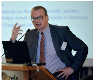
Uwe Brocks Medizinrechtsanwälte e.V.